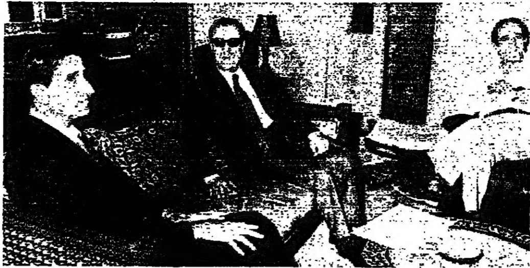
السيد جمال جنبلاط أثناء استقباله من السيد احمد لطفي متولي، ويبدو السيد شوكوت شقر

بالنسبة للأزمة اللبنانية . ويعد الاجتماع أكثر جنباط يقول: جنا زور الأخ أبو عمار لكي نضع في جو المحادثات التي جرت نسي سوريا رسالة السادات